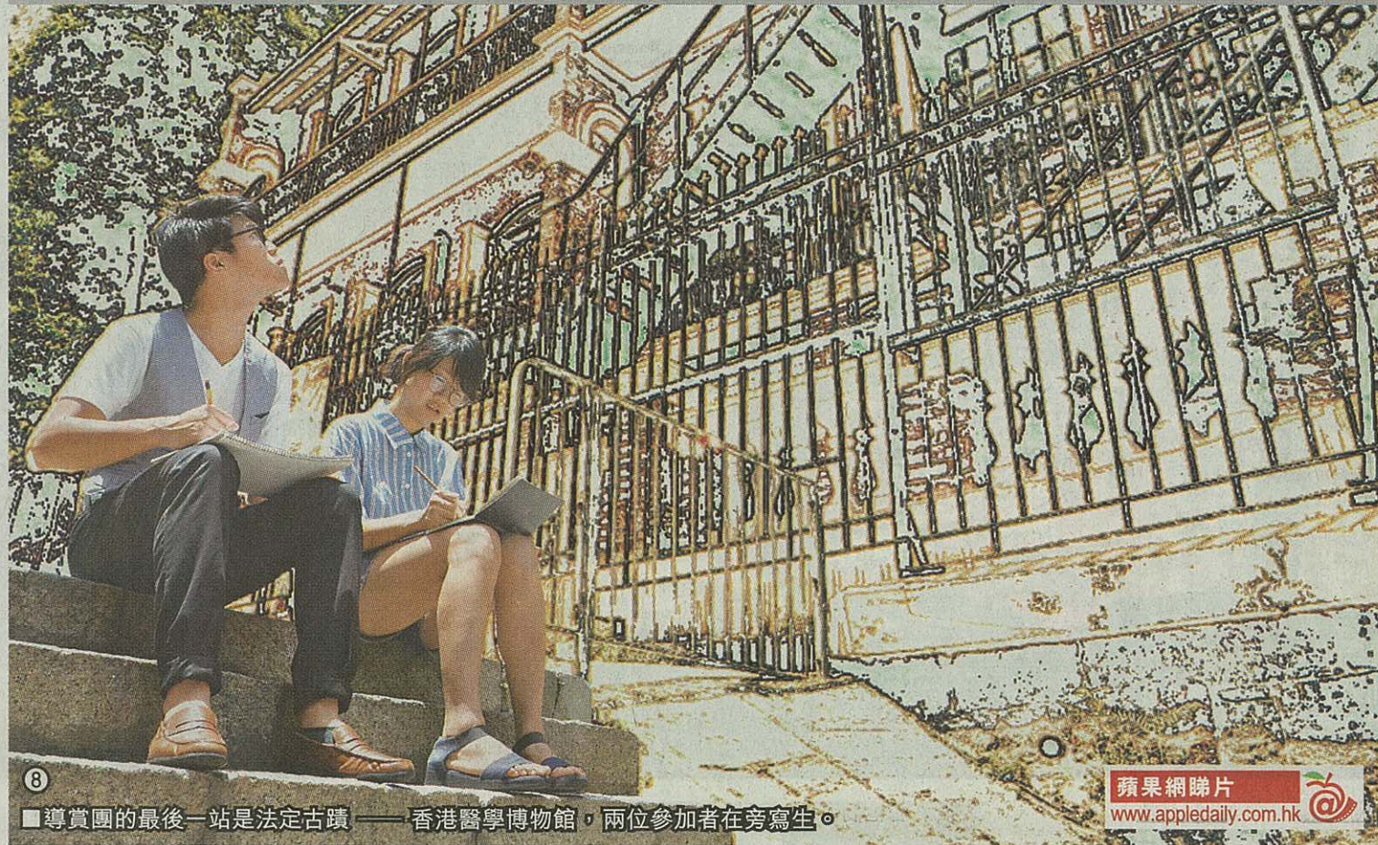
■導賞團的最後一站是法定古蹟——香港醫學博物館，兩位參加者在旁寫生。